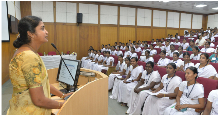
மருத்துவ அளவிகள் செவிலியர்களுக்கு பயிற்சி அளித்தல்