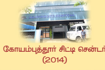
கோயம்புத்தூர் சிட்டி சென்டர் (2014)