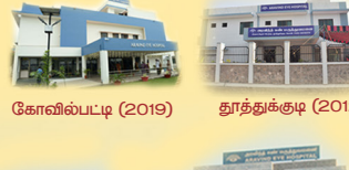
கோவில்பட்டி (2019) தூத்துக்குடி (2012)